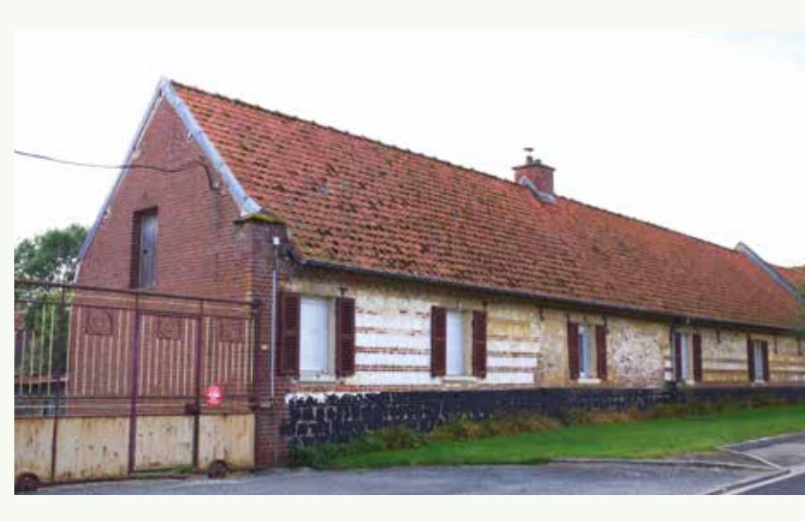
Rouges barres à Lahoussoye