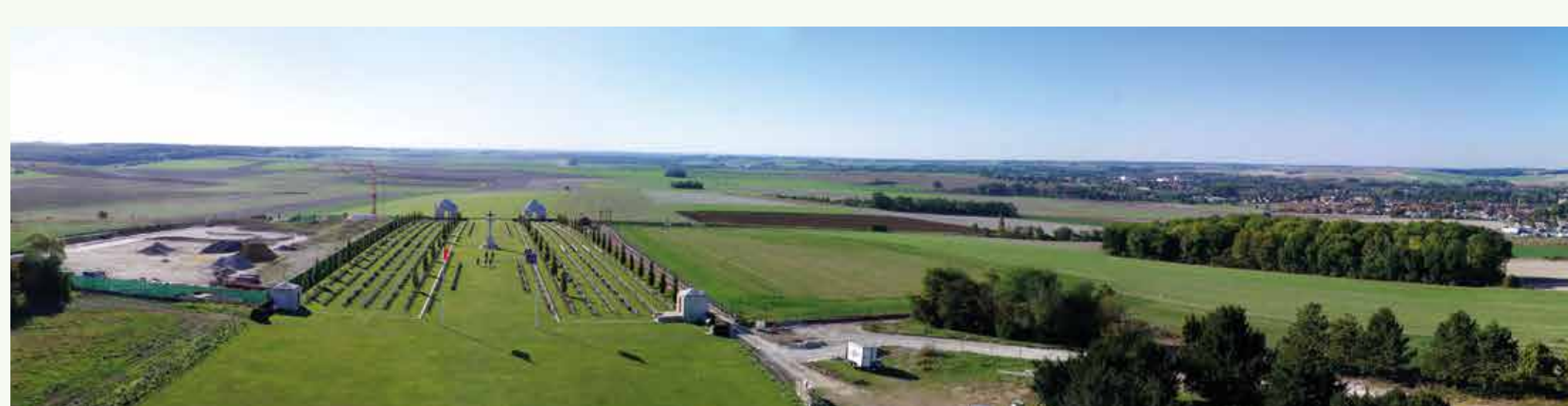
Vue depuis le Mémorial Australien de Villers-Bretonneux