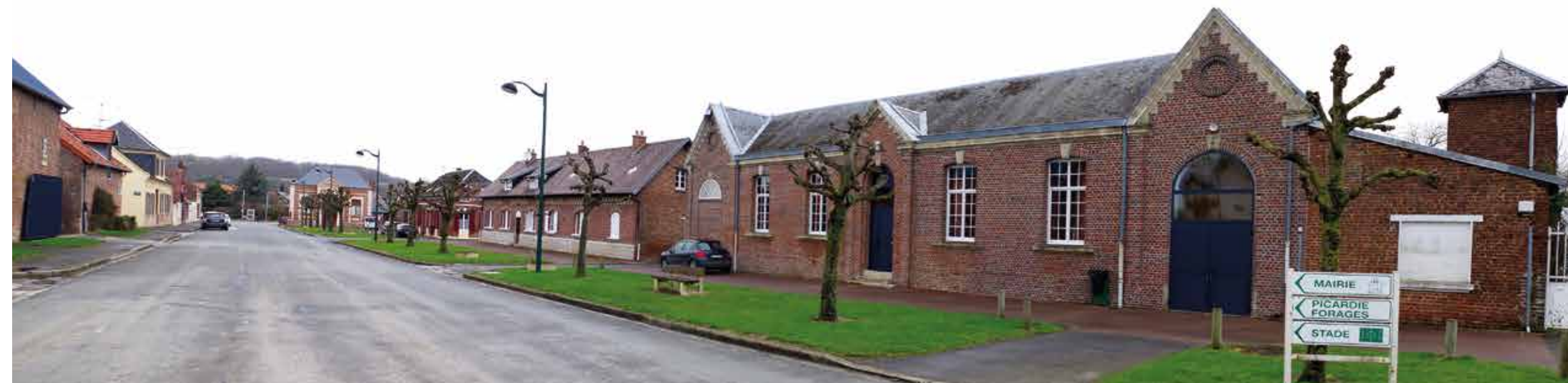
Centre-bourg de Cerisy : constructions traditionnelles picardes de qualité, espaces publics enherbés et perspective vers la mairie aménagée lors de la reconstruction