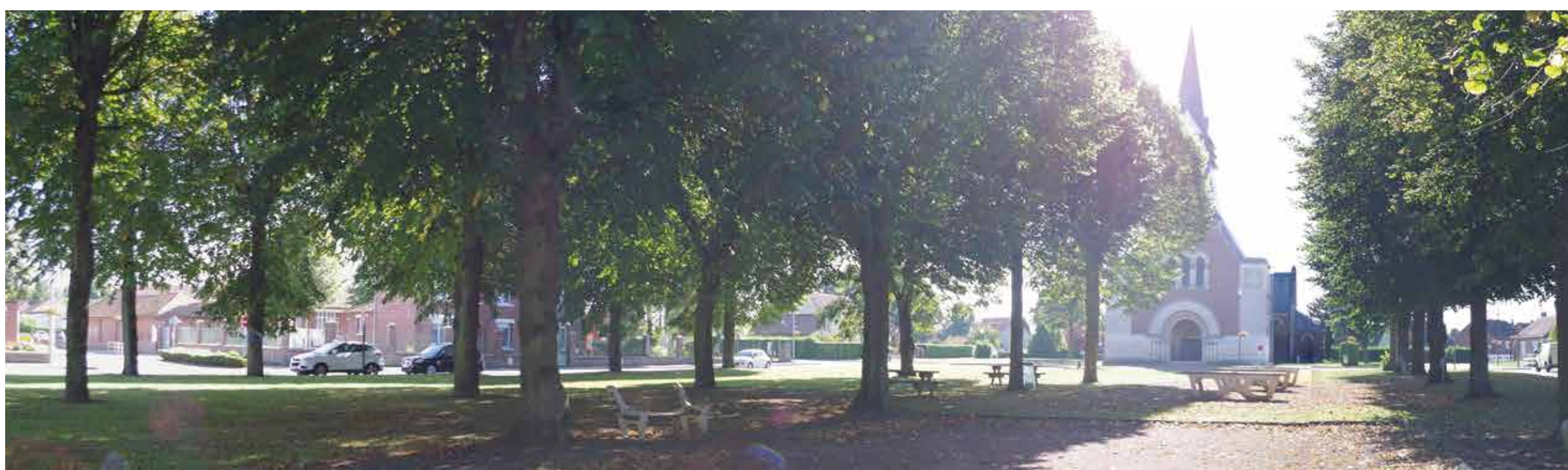
Place verte de Marcelcave : un espace public typique des villages picards, et un paysage urbain à protéger