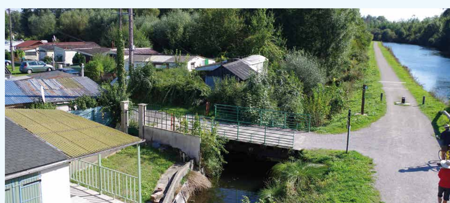
Cabanes à Vaux-sur-Somme

La gestion du phénomène de cabanisation afin de remédier aux différents problèmes qu'il pose (illégalité, logement indigne, dommages à l'environnement, sécurité des biens et des personnes)