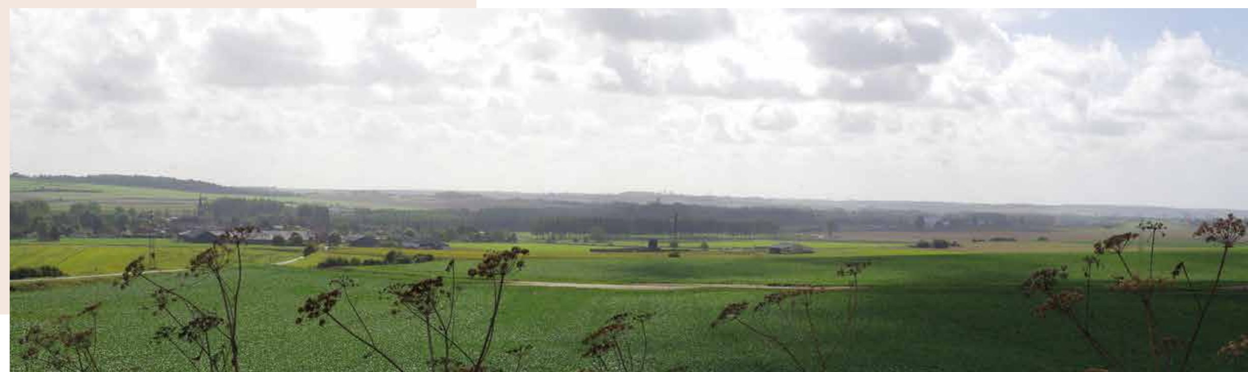
Exemple de paysage identitaire du Val de Somme : vue sur la vallée de l'Ancre et sur le village de Bonnay depuis le Nord