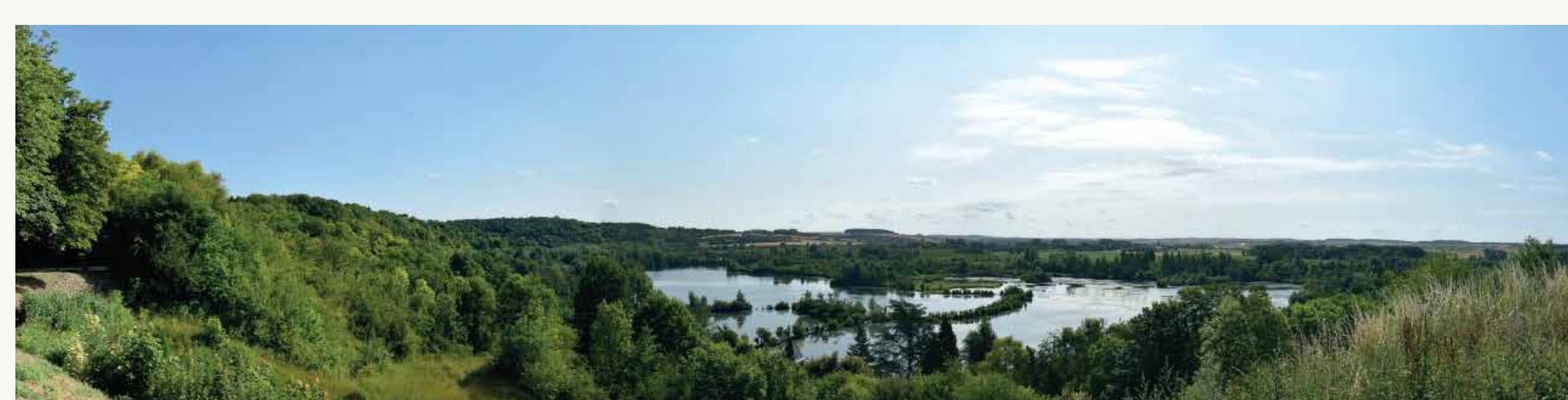
Le Belvédère Saint-Collette (Corbie)