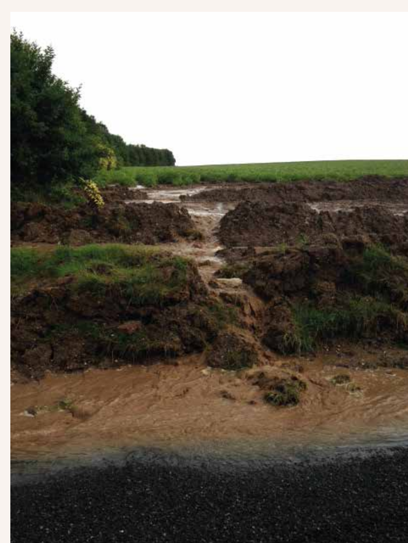
Inondation par ruissellement à Le Hamel

⊕ Ces sujets vous intéressent ? Vous voulez en savoir plus ? Vous trouverez plus d'informations dans la brochure « le val de somme de demain - objectif 2032 - n°1 diagnostic », distribuée gratuitement par la communauté de communes du val de somme !