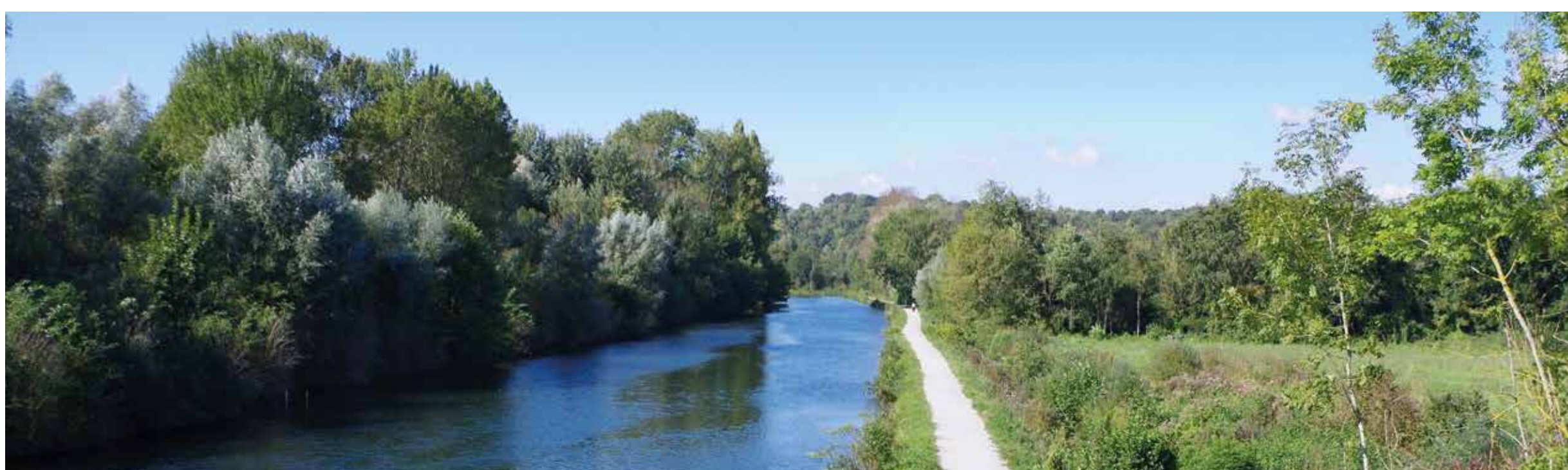
La Somme, longée par la véloroute du même nom (ici entre Vaux-sur-Somme et Vaire-Sous-Corbie) : un atout majeur pour le bien-vivre